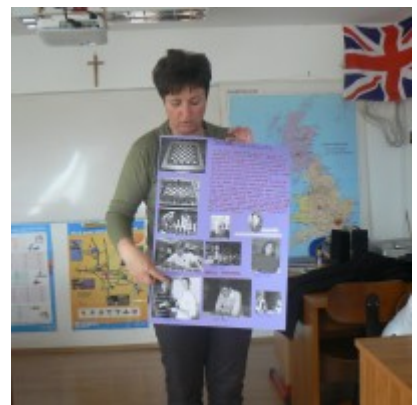
Ismerkedés a sakkal