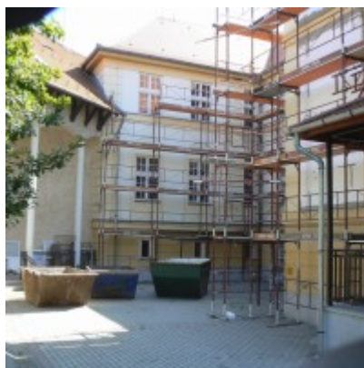
2014. augusztus 19.