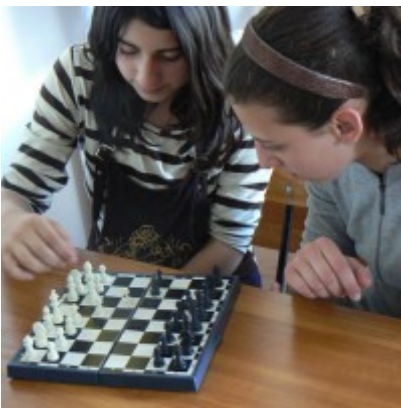
Ismerkedés a sakkal