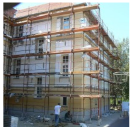
2014. augusztus 19.