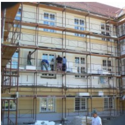
2014. augusztus 19.

A munkálatok augusztusban kezdődtek iskolánk udvar felőli részen.