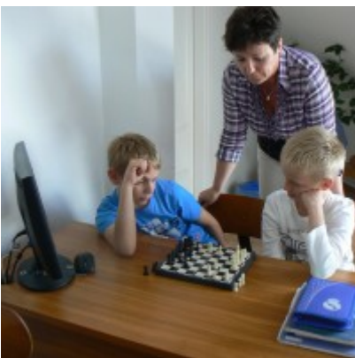
Ismerkedés a sakkal